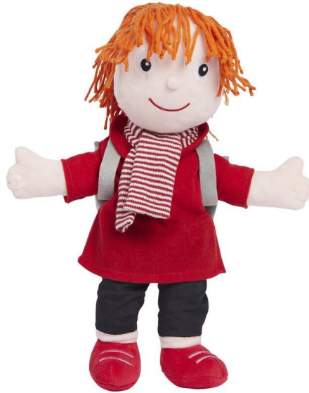
Pippa uit Piramide

Kinderen ontwikkelen zich op verschillende manieren. Er worden activiteiten aan de hele groep aangeboden in de kring en daarnaast zijn er activiteiten die we in kleine groepjes of individueel aanbieden.